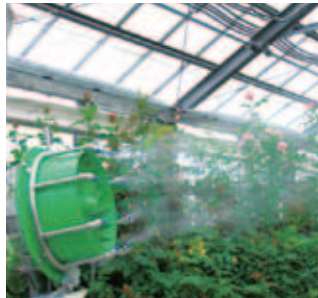
熱暑・乾燥対策 植物ハウス