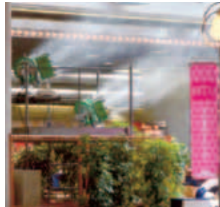
熱暑対策 商業施設