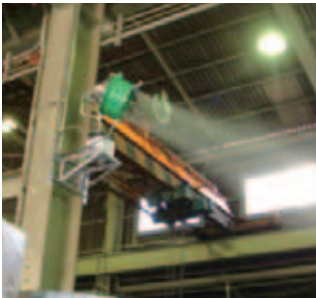
熱暑・粉塵対策 工場内