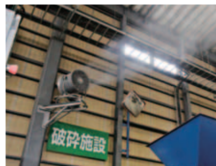
■ 粉塵対策 廃棄物処理場