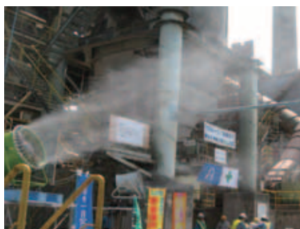
■ 熱暑対策 工場敷地