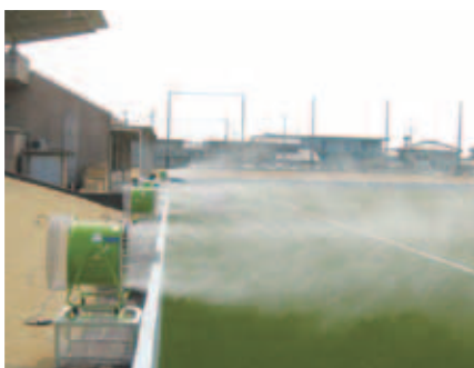
■ 芝の冷却・育成 グラウンド