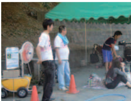
熱暑対策 グラウンド